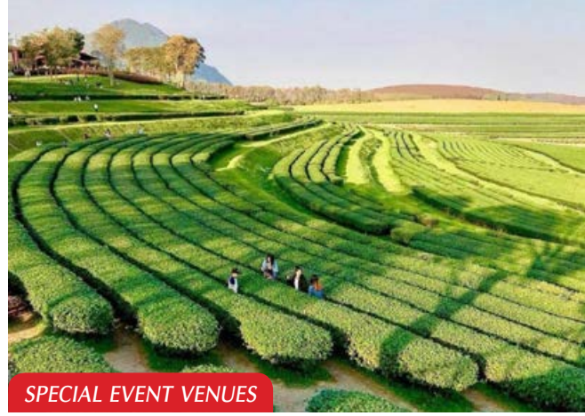
SPECIAL EVENT VENUES

Chiang Mai also has one noteworthy attraction - Studio Horjhama - a clay house that offers a new style of cuisine using organic ingredients such as weed dumplings, fried shiitake & salted fish rice balls, and wild fruit soda. Besides, MICE visitors can sample different ethnic food or participate in a plum wine making workshop (Umeshu). The activities will be held on a weekly rotation.