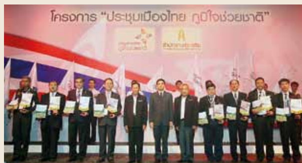
A concerted efforts by concerned public and private sectors.