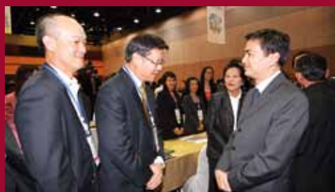
The Prime Minister Abhisit visits the Top-Table Sales activity.