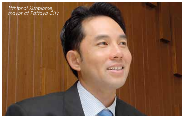
Itthiphol Kunplome, mayor of Pattaya City

นอกจากนี้ ทั้งสององค์กรจะแลกเปลี่ยนข้อมูลข่าวสารเพื่อใช้พิจารณาในการวางแผนผังเมือง ก่อสร้างโครงสร้างพื้นฐาน เส้นทางคมนาคมและขนส่งมวลชนของเมืองพัทยาให้เกิดประโยชน์และเพิ่มศักยภาพในการแข่งขันของธุรกิจไมซ์ระดับนานาชาติอีกด้วย