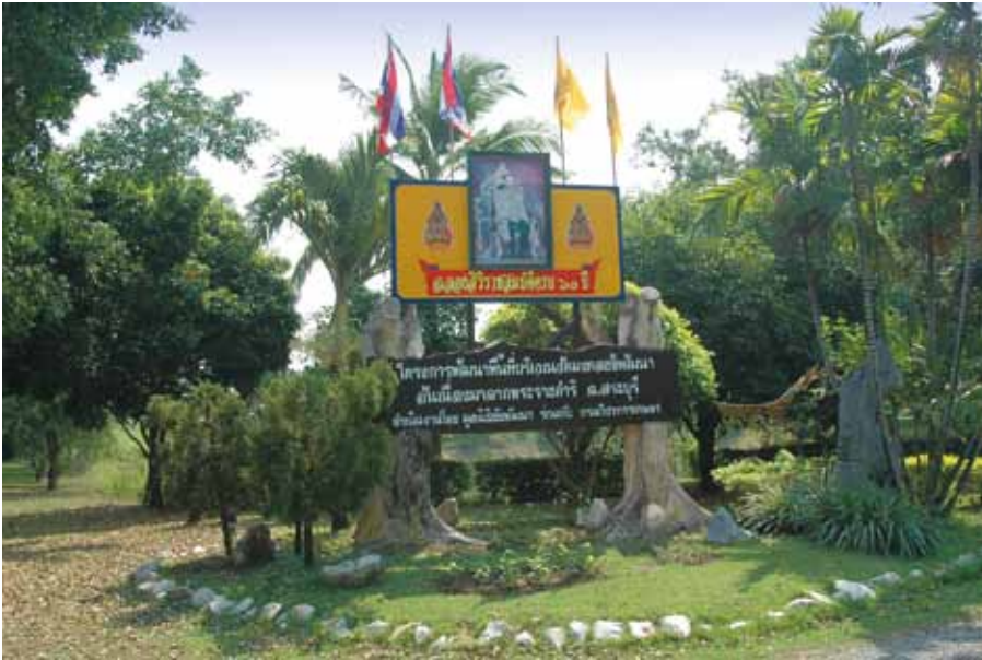
Wat Mongkol Chaipattana Royally-initiated Area Development Project