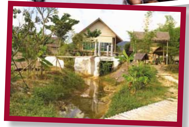
The Bhumirak Dhamachart Project