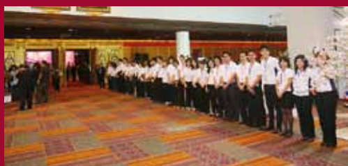
TCEB's staff welcome the Prime Minister Abhisit at a conference room