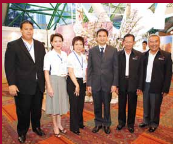
The Prime Minister Abhisit poses for a photo with TCEB's management team.