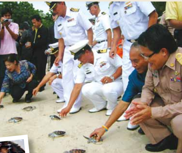
Sea Turtles Breeding Station, Koh Man Nai