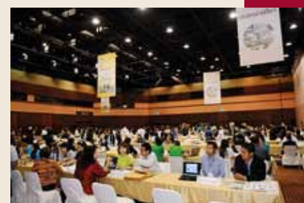
TCEB organizes Table-Top Sales.