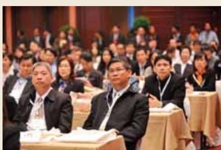
The meeting participants.