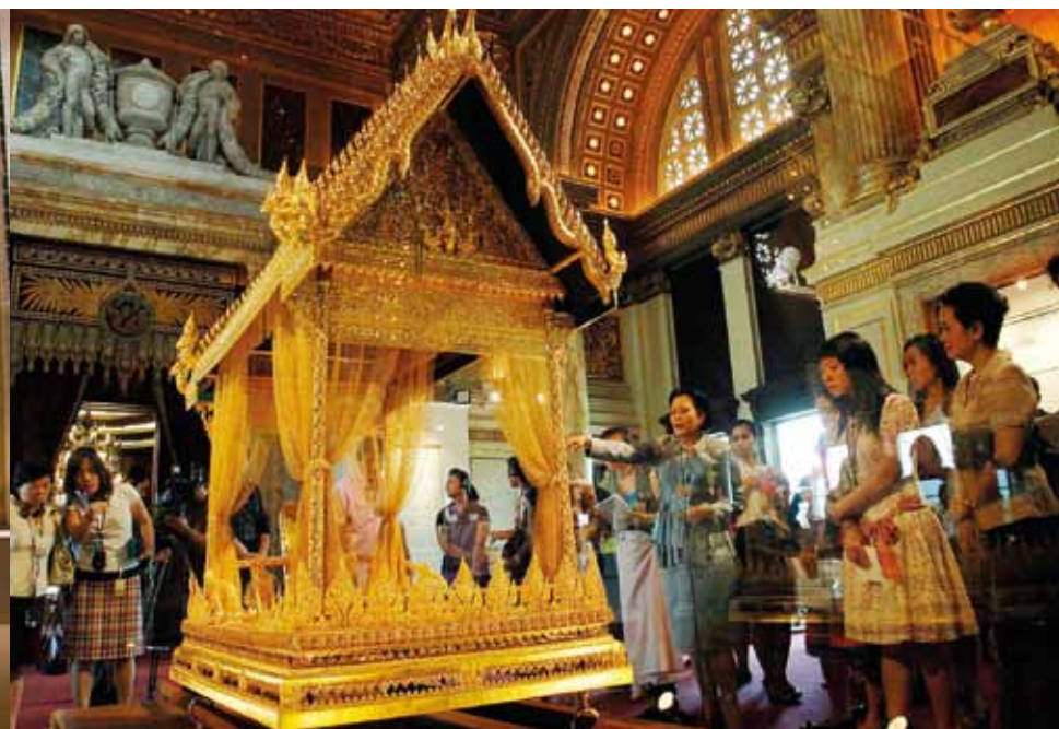
Arts of the Kingdom in Ananda Samakhom Throne Hall