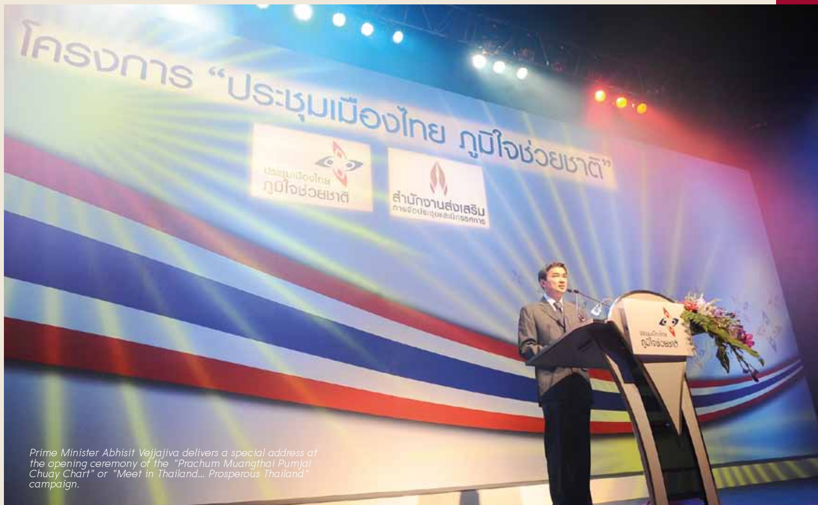
Prime Minister Abhisit Vejjajiva delivers a special address at the opening ceremony of the "Prachum Muangthai Pumjai Chuay Chart" or "Meet in Thailand... Prosperous Thailand" campaign.