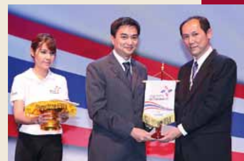
Prime Minister Abhisit gives a flag of "Prachum Muangthai Pumjai Chuay Chart" project and 32-route travel book to the private sector.