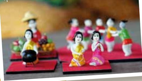
ตุ๊กตาชาววัง

ในการคัดเลือกสถานที่เข้าร่วมโครงการปิดทองหลังพระในช่วงแรก ทางคณะกรรมการฯ ได้วางหลักเกณฑ์ในการพิจารณา คือ อยู่ในหรือใกล้เมืองท่องเที่ยว มีการ