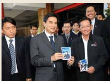
Prime Minister Abhisit and Deputy Prime Minister Major General Sanan show off the photos taken at TCEB booth.