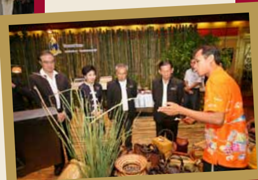
Deputy Prime Minister Major General Sanan, right, visits a booth of the Royal Initiative Discovery project