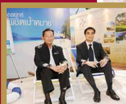
The Prime Minister Abhisit and Deputy Prime Minister Major General Sanan visit TCEB booth.