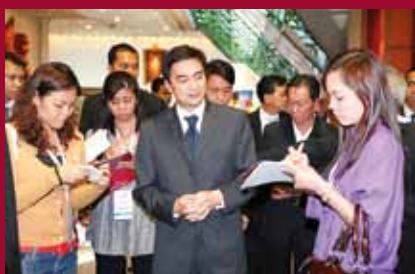
The Prime Minister gives an interview to the media.