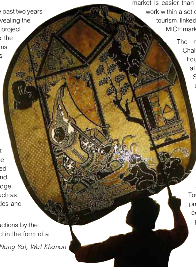
Nang Yai, Wat Khanon

Now that the selection of participating destinations has been completed, the sub-committee will be coordinating with the Tourism Authority of Thailand (TAT) to start promoting them. In the first year, the sub-committee has set a budget of Bt30 million to publicize the destinations and expects the 2 million visitors a year to royal projects to