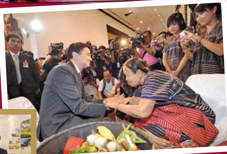
A villager gives Prime Minister Abhisit a traditional welcome.