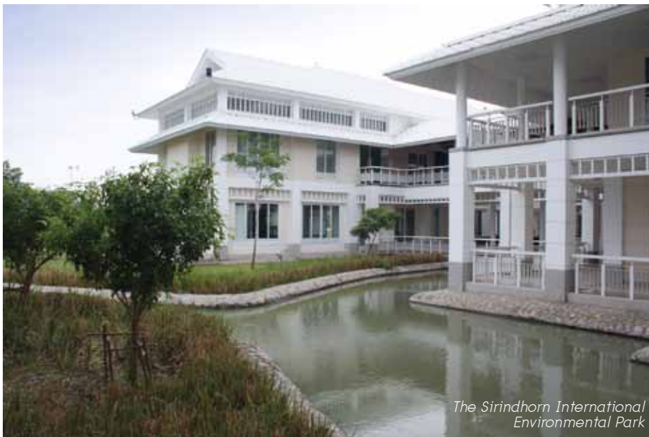
The Sirindhorn International Environmental Park