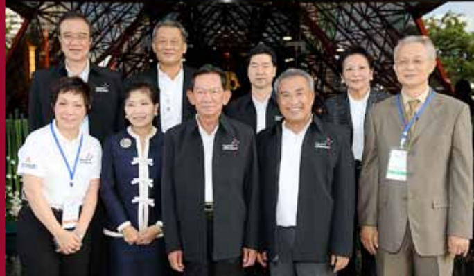
Deputy Prime Minister Major General Sanan Kachornprasart, center, and the project's team.