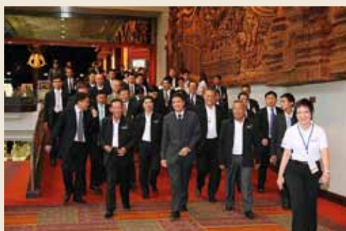
Deputy Prime Minister Major General Sanan Kachornprasart, front left, welcomes premier Abhisit at the event.