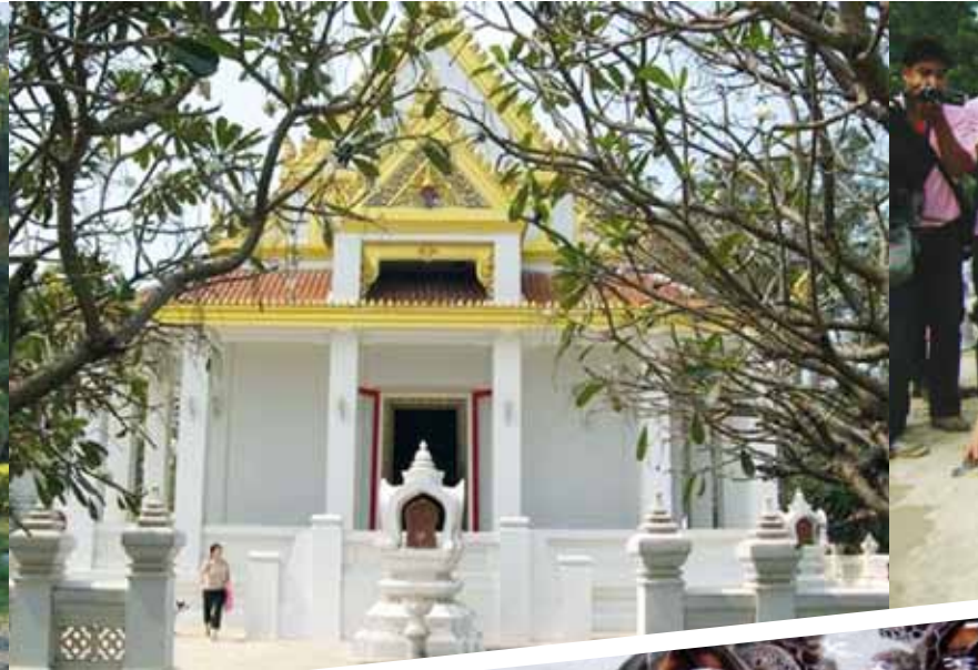
Wat Tha Sutthawat, Ang Thong

ปรับปรุงสถานที่ เพื่อให้มีมาตรฐาน และมีความพร้อม ในการรองรับกลุ่มนักท่องเที่ยวทั้งชาวไทยและชาวต่างชาติ เช่น ห้องน้ำ บ่าย มัคคุเทศก์นำเที่ยว และแผ่นพับ เพื่อเผยแพร่ข้อมูลโครงการ