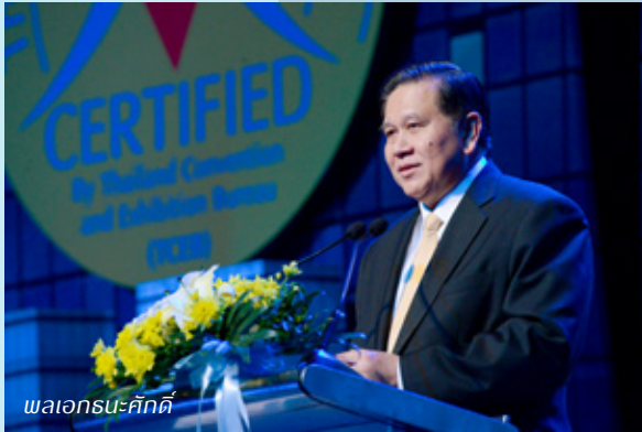
พลเอกธน-ศักดิ์