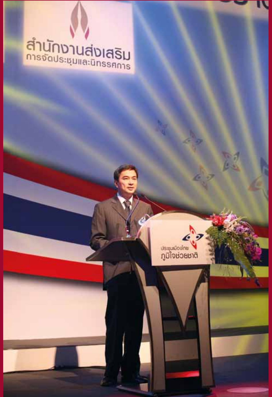
Prime Minister Abhisit Vejjajiva presides over the opening ceremony of Domestic MICE campaign