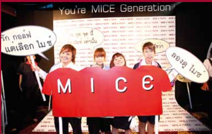
MICE 4 YOUTH