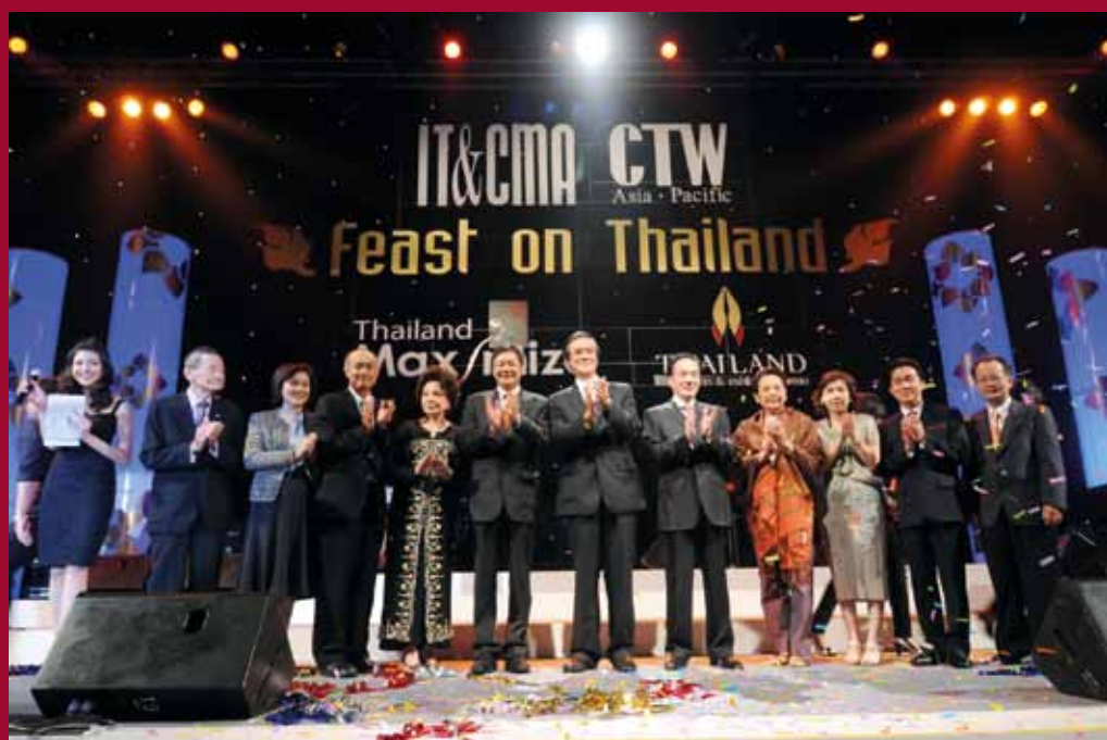
17th IT&CMA and 12th CTW Asia Pacific