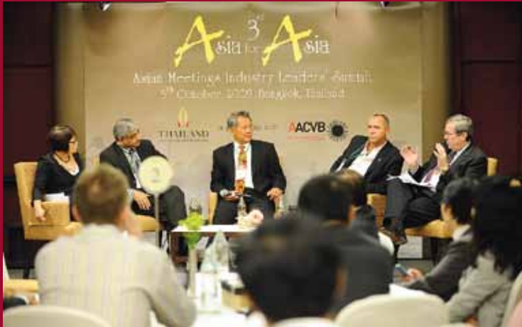
The 3rd Asia for Asia Summit