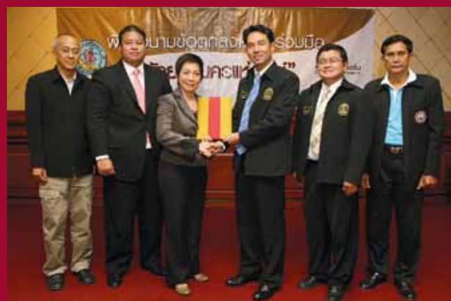
TCEB ties up with the City of Pattaya to develop Pattaya MICE City