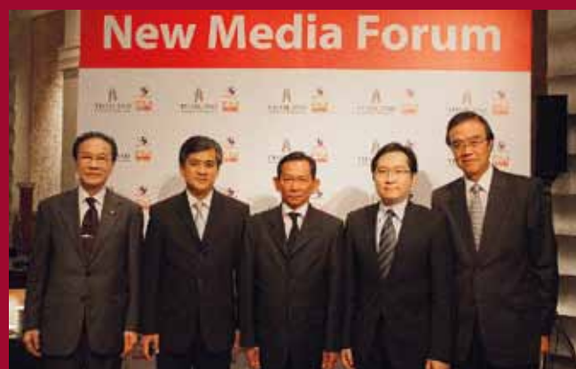
New Media Forum for MICE and service businesses