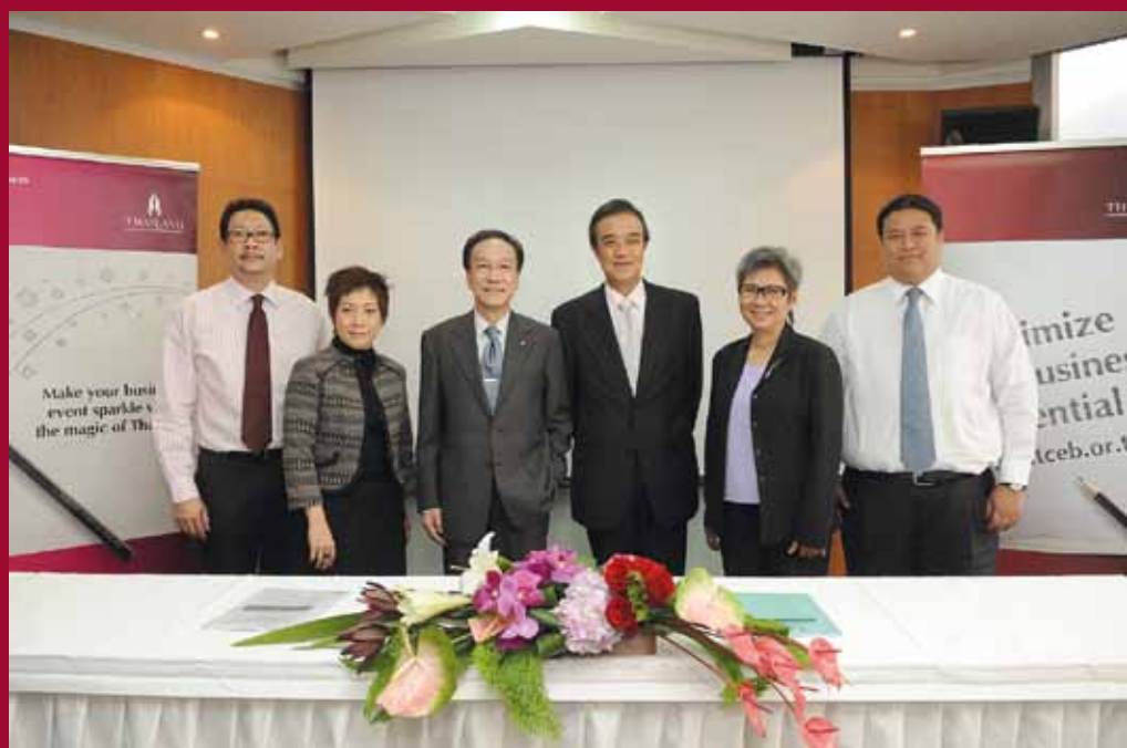
New TCEB executive press conference