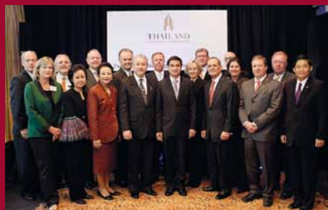
New York meeting & exhibition road show