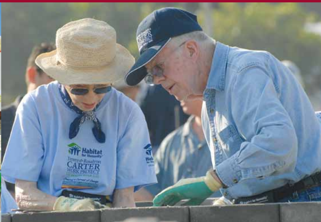
TCEB joins Habitat for Humanity to support the 26th Jimmy Carter and Rosalynn Work Project – Mekong Building 2009 in Chiang Mai