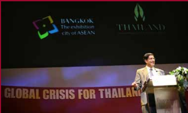
Dinner Talk Forum