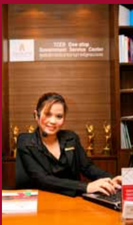
TCEB's One-Stop Government Service Center