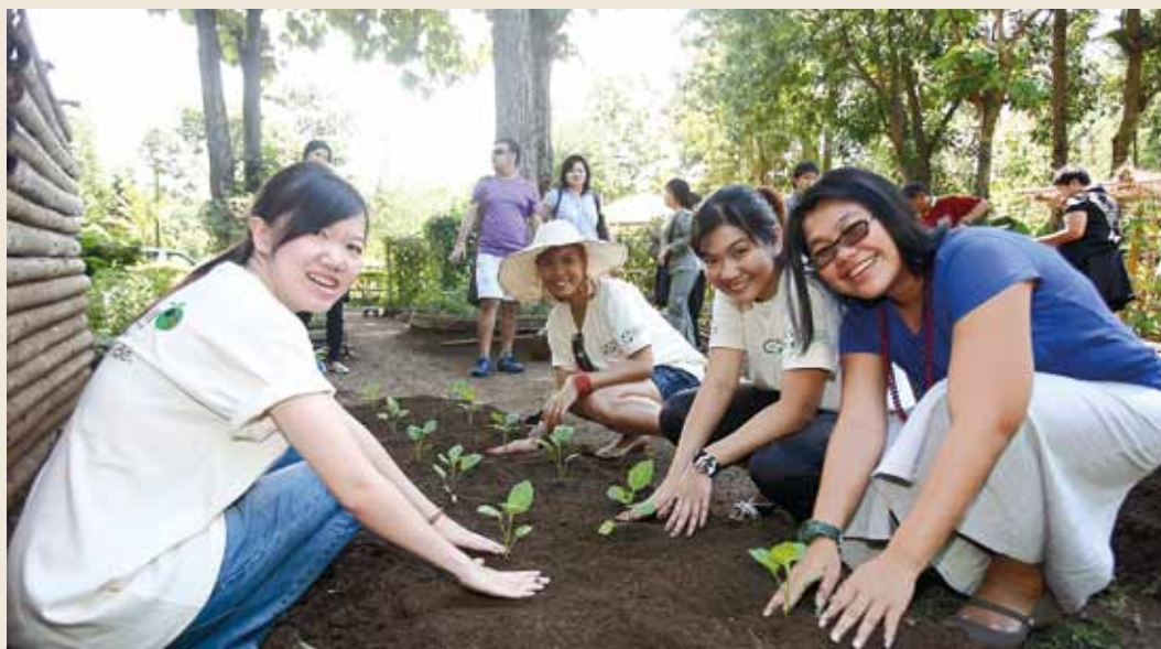
Planting at Huai Hongkhrai

A recent TCEB survey of Chiang Mai's MICE market has revealed that 70 per cent of the total market in meetings & incentives (MI) and conventions & exhibitions (CE) remain weak. Therefore, the creation of a strategic marketing strategy would help place greater emphasis on the CE market, which should eventually boost the MI market.