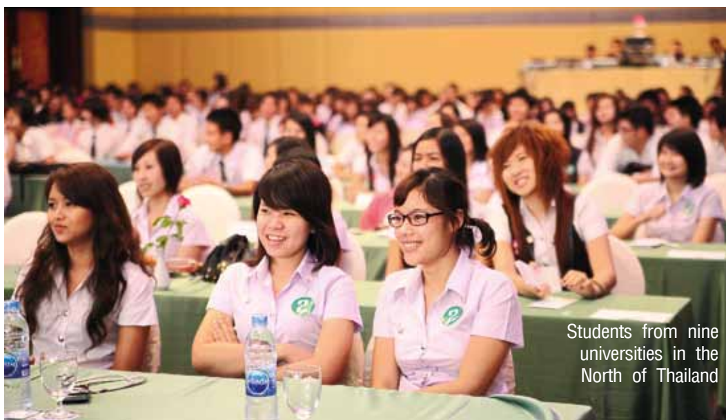
Students from nine universities in the North of Thailand

In order to achieve this objective, the province has set a system of cluster management comprising the public and private sectors, academics, research entities as